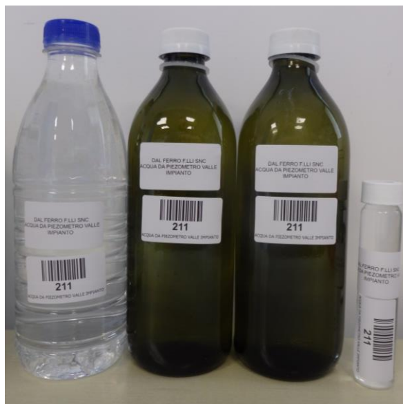
FOTO DEL CAMPIONE