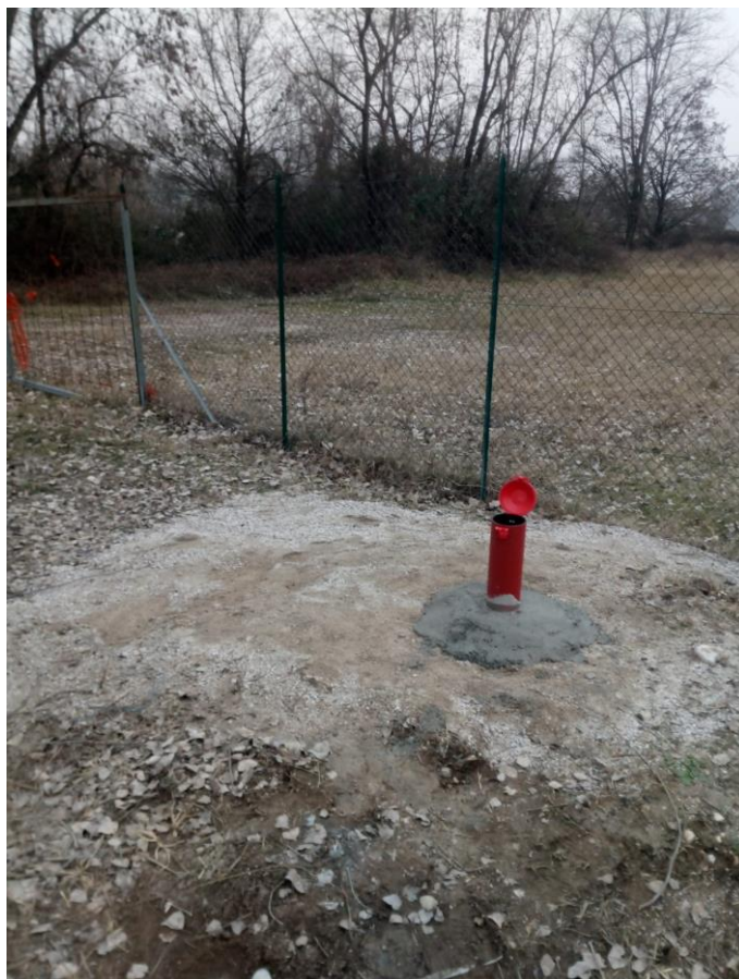
FOTO DEL PUNTO DI CAMPIONAMENTO